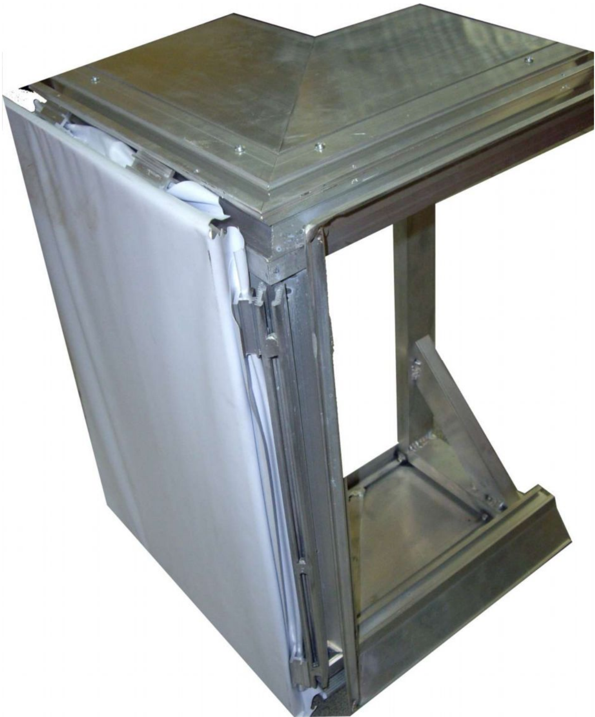
Fot.2. Widok z boku ( jedna strona z zapiętym winylem ).