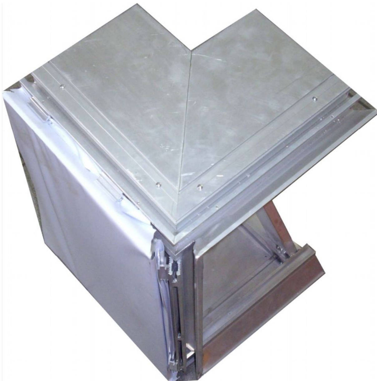
Fot.1. Widok narożnika ze zdjętym kątownikiem maskującym.

Narożnik wykonany z następujących profili: