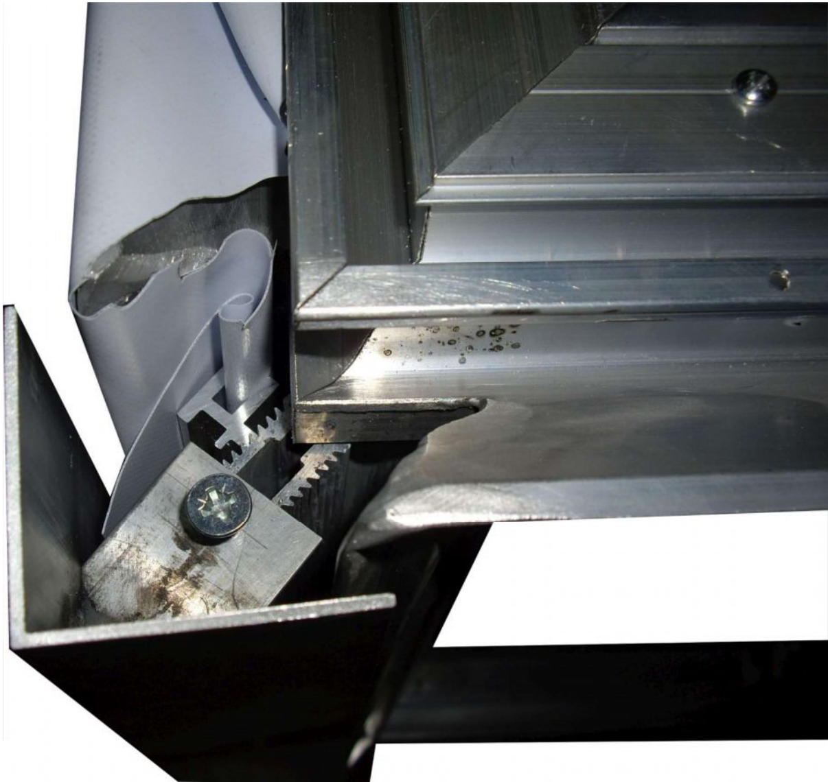
Fot.4. Widok po dokręceniu pokrywy maskującej narożnik.