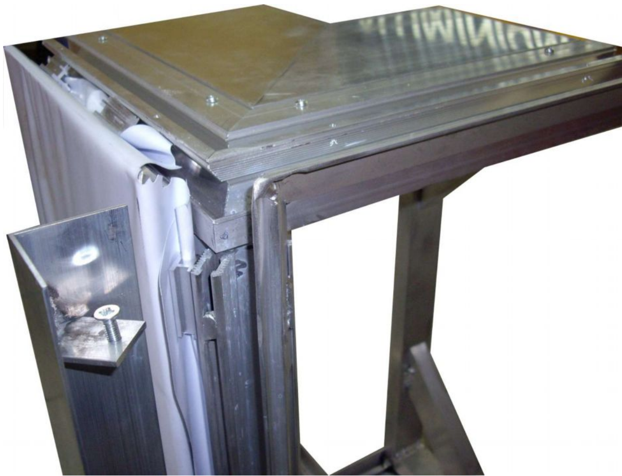
Fot.3. Widok pokrywy maskującej od środka ( sposób mocowania do ramy „classic” )